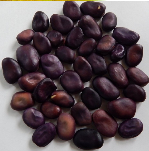
Бобово е зерно