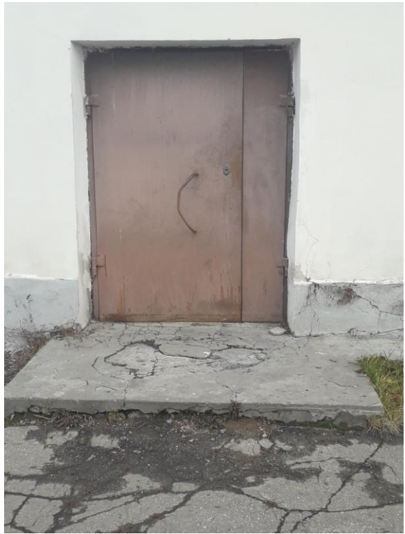
Фото №2. Запасные выходы.