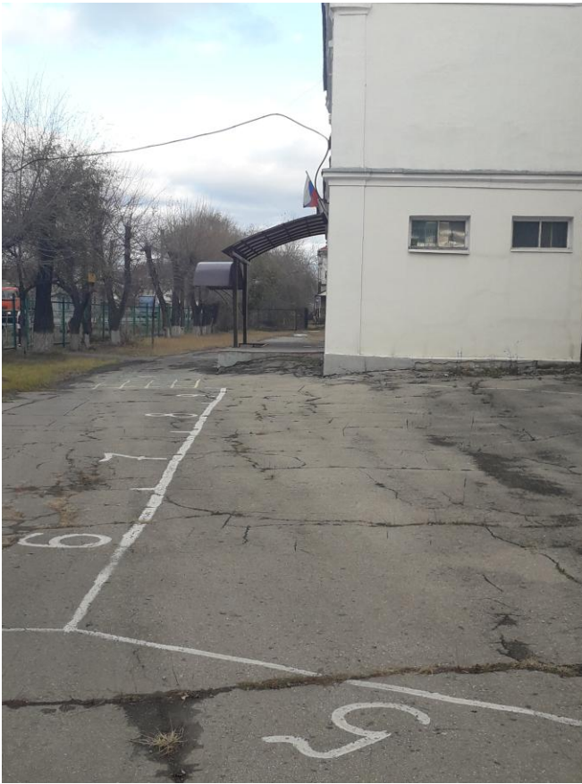
Фото № 3. Территория школы.