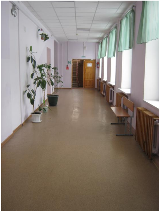
Фото № 8. Коридор 1 этаж.