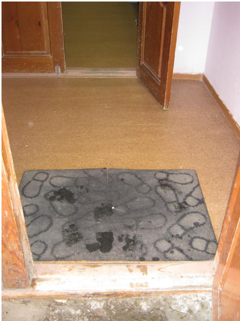
Фото №1. Центральный вход.