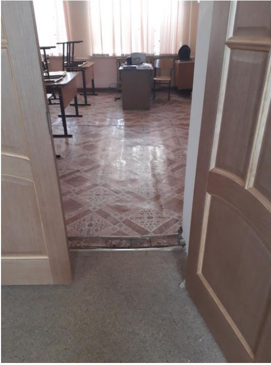
Фото №9. Вход в кабинет