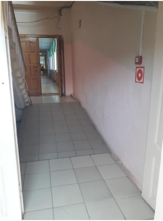
Фото №7. Эвакуационный выход.