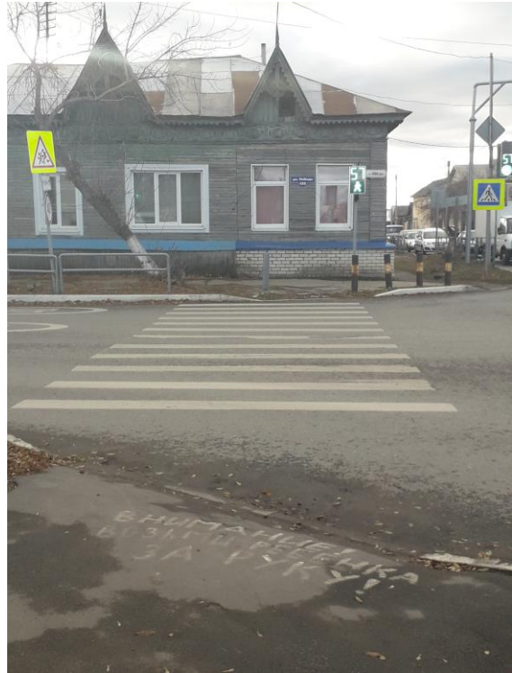
Фото № 5. Перекресток.