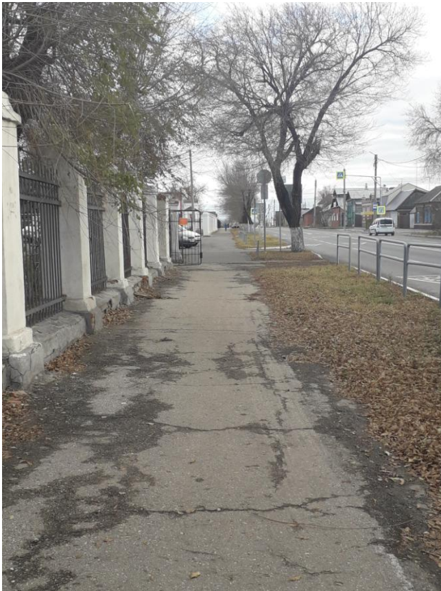
Фото №4. Дорога до школы от перекрестка.