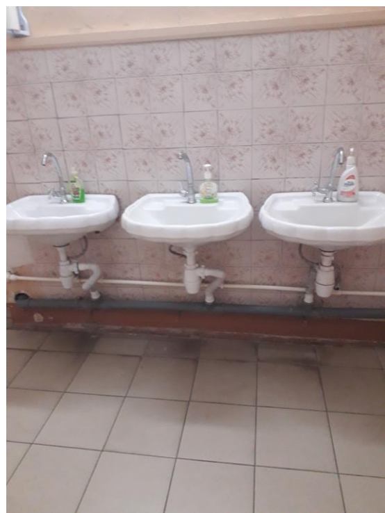
Фото № 10. Туалет.